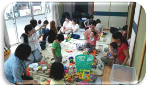
◆巽南 子育てサークルしゃぼん玉