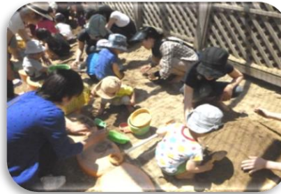
◆東桃谷 もこピヨらんど