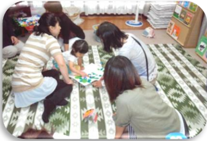
◆鶴橋 えがおくらぶ

生野区では、16の地域で主任児童委員を中心に子育てサロンを開催し、就学前の子どもと保護者・妊娠中の方など、育児に関わる方が友だちの輪を広げる場所と機会を提供しています。夏はプール遊び、天気の良い日は砂場あそび、12月はクリスマスなど、地区独自の楽しいイベントがいっぱいです。