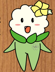
平野区マスコットキャラクター 「ひらちゃん」

平野区は大阪市の東南部に位置し、東は八尾市、西は東住吉区、南は松原市、北は生野区及び東大阪市に接していきまして、人口は市内で第1位、区域面積は市内で第3位になります。民生委員児童委員協議会は、18地区で構成され、延べ250名の民生委員・児童委員（内主任児童委員34名）が区役所をはじめ関係機関と連携しながら地域の身近な相談者、支援者として日々活動をしています。今年度は新型コロナウイルスの影響で活動も制限されるなか、地域福祉の向上を目指して活動を行っています。