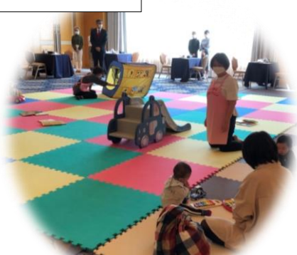
たくさんの親子でにぎわいました