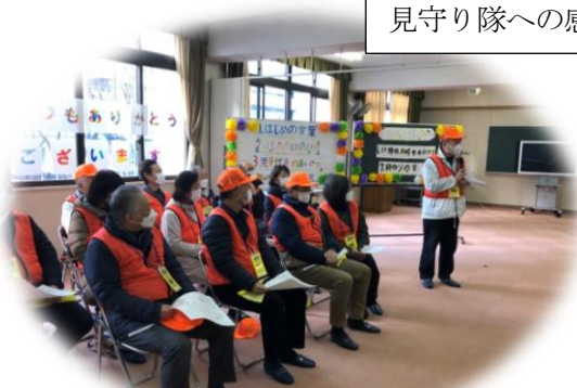
日頃の感謝を込めて小学校で行われました