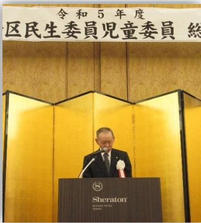
生野区民生委員児童委員協議会