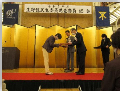
御幸森地区 楠原委員長（左）