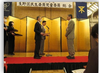
生野南地区 岡野委員長（右）