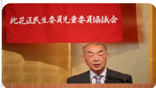
此花区民生委員児童委員協議会

令和4年12月の一斉改選により新任の15名を含め、114名で新たなスタートを切り半年を経過し、新体制での初めての総会となりました。前期の3年間は新型コロナウイルス感染症の影響により行動が大きく制約を受けた中で、委員の皆様様の弛まぬ努力により、区版見守り活動マニュアル作成に加え、災害時の個別避難画作成に向けての基礎作り等、今後の活動の地盤固めが進められました。今年度は、これらの成果をステップとして活動の幅を広げていきたいと思っております。(令和4年度の事業報告等については総会資料を参照)