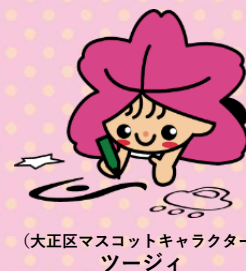
(大正区マスコットキャラクター) ツージィ

※開催日が祝日の場合はお休みです。 ※感染症の流行状況により、開催中止する場合があります。 ※開催日は変更する場合があります。初めて参加される方は、あらかじめ主任児童委員にお確かめください。