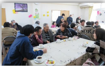
皆さんで情報交換

北巽社会福祉協議会、巽地域包括支援センターが主催する「おやしカフェ」に北巽地区民生委員児童委員協議会も参画しており、1月30日に北巽会館老人憩いの家でカフェが開かれるということで、お伺いしました。