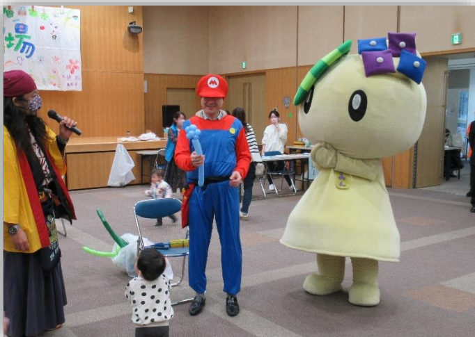
マリオと生野区マスコットキャラクター「いくみん」も来たよ♪