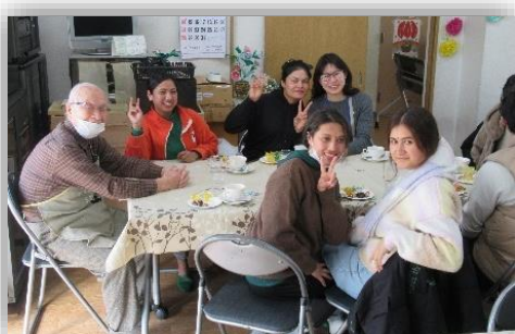
連合町会長さんと外国人留学生

連合町会長さんはじめ、地域の皆さんが多く参加され、にぎわっていました。北巽は多文化共生のモデル地域であり、カフェは外国人留学生と文化交流を深めるための場にもなっています。